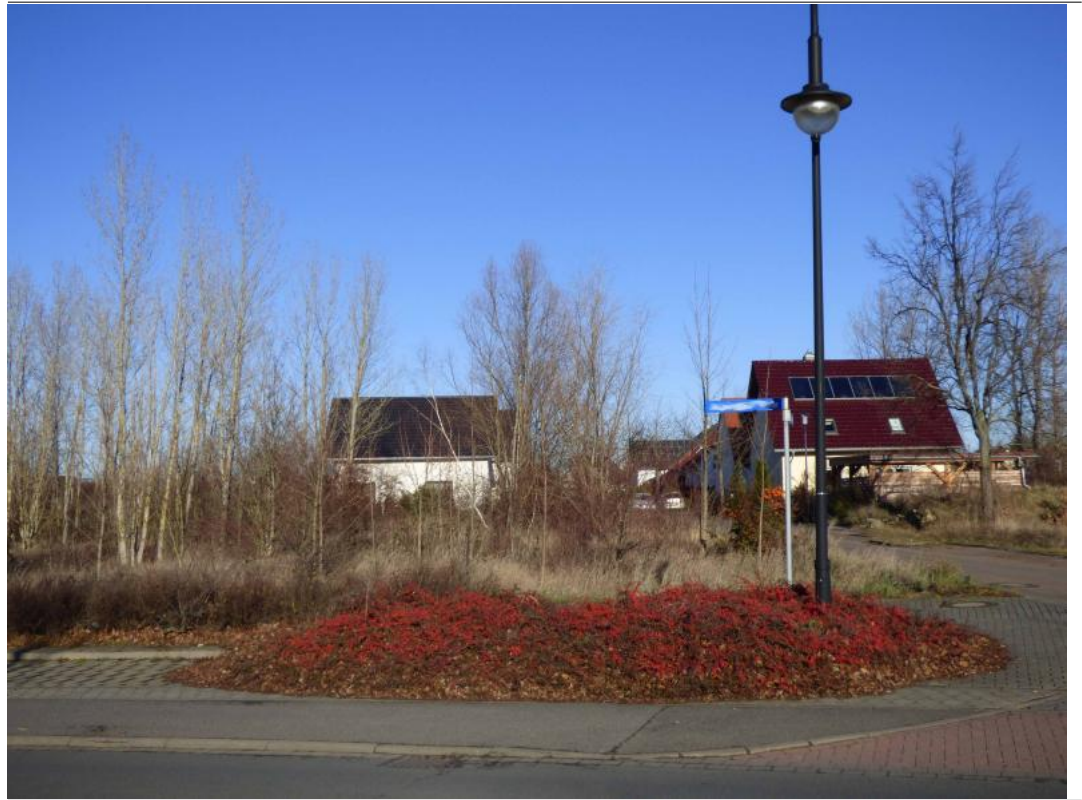
Blick zum Grundstück