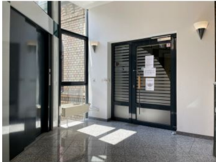
Treppenhaus + Aufzug