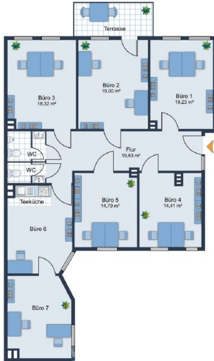
Grundriss 2.OG (DG)